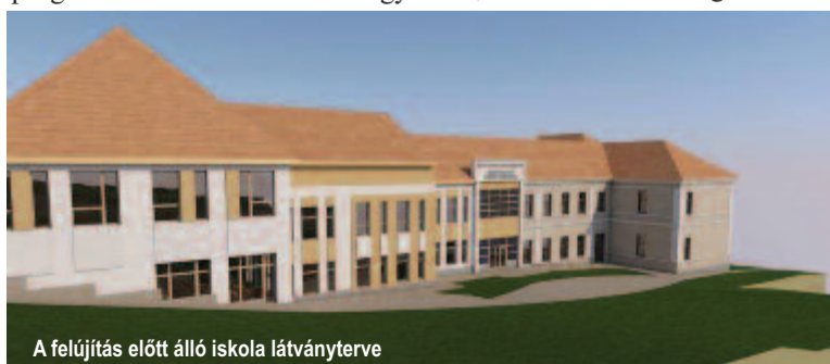
A felújítás előtt álló iskola látványterve

Egy másik jelentős előrelépés az oktatási infrastruktúra terén, hogy a város megnyert egy pályázatot a Dózsa György utcai iskola korszerűsítésére és bővítésére. Az 1900-as évek elején épült ingatlan teljes felújítására a Nemzeti Fejlesztési Alapnál nyertek közel egymillió euró támogatást. A tanintézetbe jelenleg a magyar elemi tagozat jár, amint befejeződik a korszerűsítés és bővítés, másfélszeresére nő az épület befogadóképessége, megújul az iskola udvara is, és azt tervezik, hogy a nyolcadiktól a nyolcadik osztályig oda költöztetik majd a magyar és román tagozatot egyaránt. A polgármester reméli, hogy idén eljutnak a licit megszervezéséig, és jövőben elkezdődhet a munkálata.